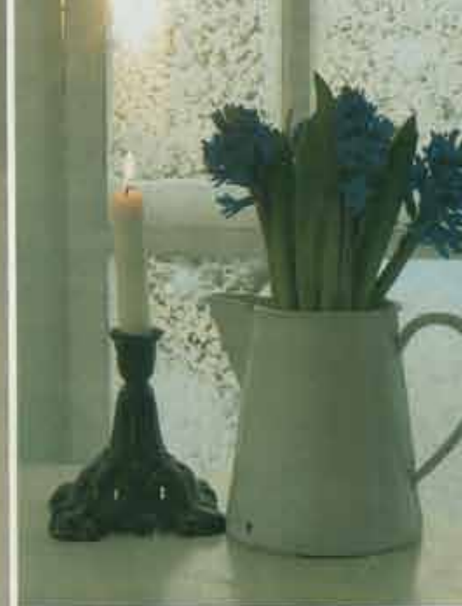
OVENFOR: De sprossede ruder kommer i ekstra julestemning, når de bliver pyntet med Verherms egne blandedagblomster.