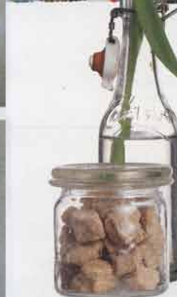
Mælketaske med patenttag, h 20 cm, 35 kr.; Diverse Sukkerskål, h 5 cm, 15 kr.; Pjot.