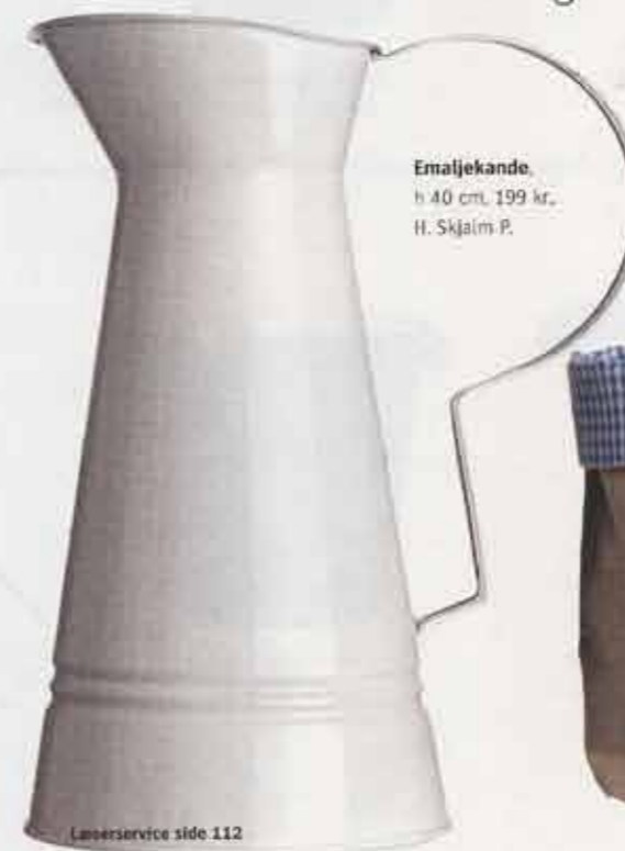
Emaljekanade, h 40 cm, 199 kr., H. Skjalm P.