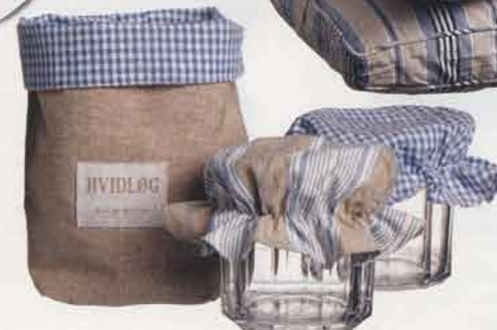
Opbevaringspose i hør, h 20 cm, 52,50 kr., hætter til marmeladeglas, 30 kr. pr. stk., marmeladeglas, h 10 cm, 15 kr. pr. stk., H. Skjalm P.