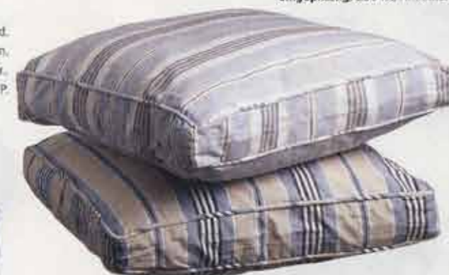
Hyndebetræk i bomuld, h 40 x d 40 x h 6 cm, 95 kr., hynde, 59,50 kr., H. Skjalm P.