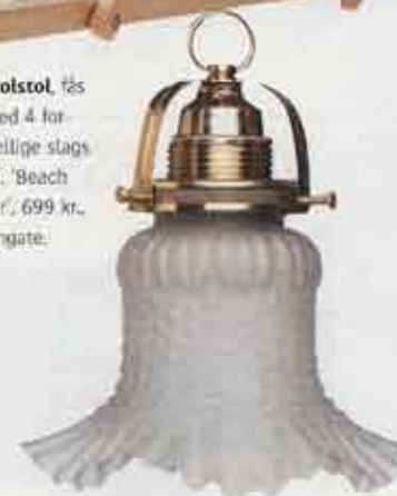
Skærm, fås i flere mønstre og farver, h 20 cm, 100 kr., messingophæng, 250 kr., Amkilde.